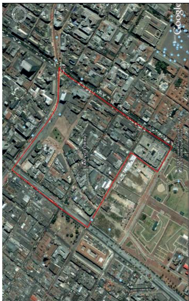
Figura 2. Localización del PPSV.

Para ser exactos, al norte delimita con la calle 13 (Av. Jiménez de Quezada); al sur, con la calle San Joaquín (calle 10); al oriente, con la Av. Fernando Mazuera (carrera 10ª), y al occidente, con la Av. Caracas (carrera 14). En total son 14 manzanas catastrales: 10 correspondientes al barrio Santa Inés, y 4 establecidas en el barrio La Capuchina, pertenecientes a la Unidad de Planificación Zonal (UPZ) 93 Las Nieves, de la localidad de Santa Fe.