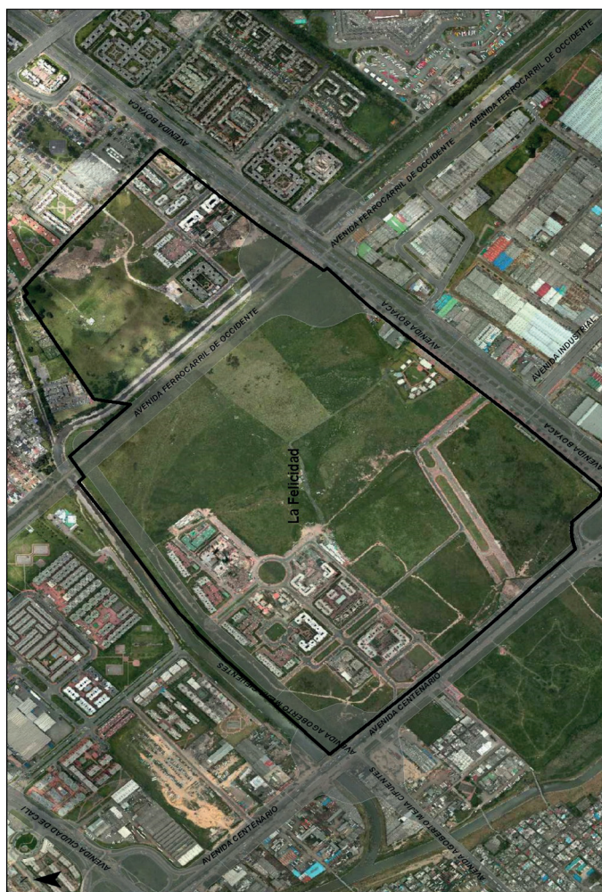
Figura 3. Localización del PPLF.

EL PPLF se ejecuta en una zona de tratamiento urbano en desarrollo, que consiste en un área urbanizable no urbanizada. Fue uno de los primeros PP formulados en el país y uno de los más grandes de Colombia. Opera en una de las zonas de mayor valorización de la ciudad, en cercanía a un sector que durante muchos años acogió una zona industrial y de bodegaje. La Felicidad, al noroccidente delimita con Modelia Sector E-Centro de Control EAAB-Zona de Servidumbre del Ferrocarril; al nororiente, con la Urbanización La Esperanza Etapa A; al suroriente, con la Avenida Boyacá; y al suroccidente, con la Avenida Centenario. El proyecto se ubica en un terreno sin manzanas y, hasta antes de su formulación, estaba ligado a los sectores Centenario, La Esperanza y barrio Modelia de la Unidad de Planificación Zonal (UPZ) 112 Granjas de Techo en la localidad de Fontibón.