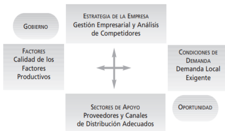
Gráfico 4. Diamante de la Competitividad por Michael Porter

Fuente: CAMARA DE COMERCIO DE MEDELLIN. Clúster una estrategia para crear ventaja competitiva. [sitio web] Medellín. CO. 2008, P9. Consultado [24, Julio, 2018] Disponible: http://www.camaramedellin.com.co/site/DesktopModules/Bring2mind/DMX/Download.aspx?Command=Core_Download&EntryId=64&PortalId=0&TabId=515