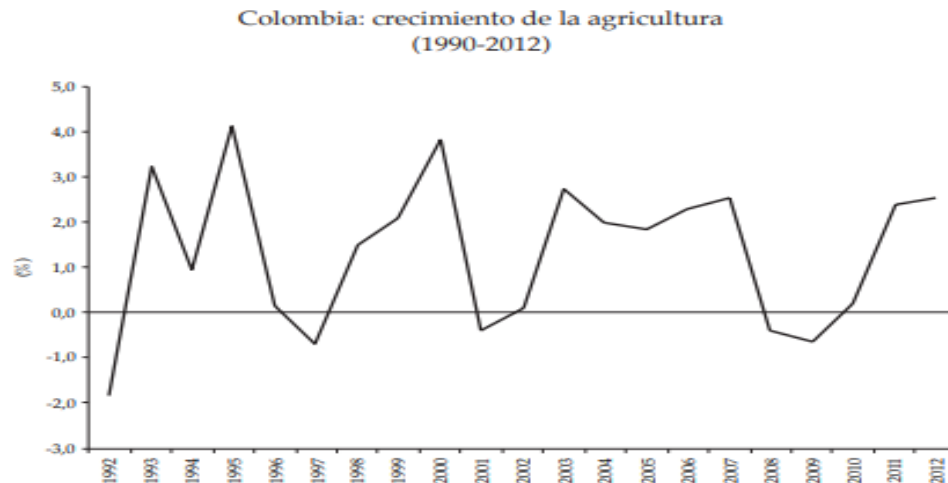
Gráfico 3. Participación de la agricultura colombiana en el PIB