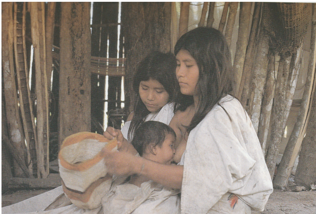
Cuando la mujer teje una mochila, va pensando en sus hijos, la familia y la vida. Va tejiendo sus pensamientos. Camino a ciudad perdida, Sierra Nevada de Santa Marta.

hombre teje en el telar. Por último, la mujer elabora los bordados y tejidos especiales de los bordes extremos de las partes que componen la indumentaria. Al pantalón y a la “manta” (ruana o camisona) se le hacen los bordados en sus extremos inferiores; a la faja el tejido especial en sus extremos.