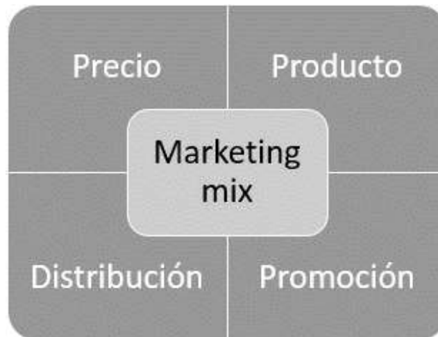
Imagen 4. Componente de marketing Mix

El marketing mix es un conjunto de instrumentos tácticos que tenemos a nuestra disposición para alcanzar los objetivos de la empresa e influir su mercado objetivo, los elementos del marketing mix están formado por: distribución, producto, precio, y promoción.