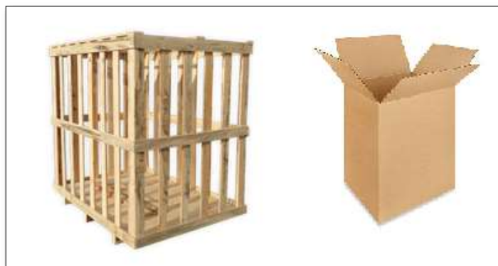
Imagen 7. Tipos de embalaje para la exportación

Fuente: ULINE. Expertos en embalaje. [En línea]. Bogotá D.C.CO. Sec. Cajas y Corrugados. Sf. [Citado 30, Junio 019]. Disponible en: https://es.uline.mx/Grp_9/Boxes-200-Test