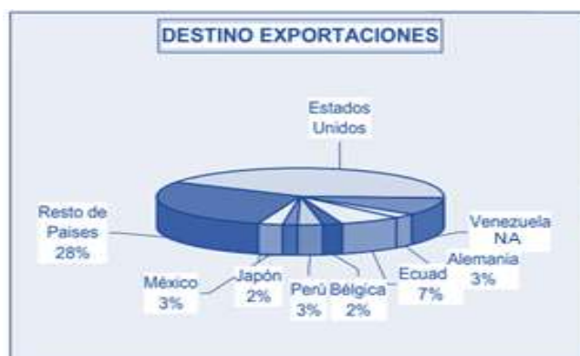
Grafico 2. Destino de las exportaciones en Colombia

Fuente: ICEX. El mercado del cosmético y la belleza en Colombia. [En línea]. Bogotá D.C.CO. sec. Productos. Sf. [Citado el 29 de mayo del 2019]. Disponible en: www.exportapymes