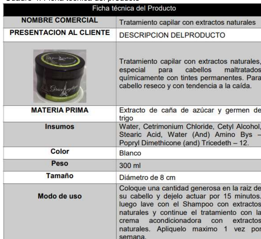
Cuadro 4. Ficha técnica del producto

Los tratamientos capilares están en auge ya que el gran porcentaje de la población tiene maltratado el cabello debido a tinturas permanentes, mal cuidado y polución, sumando a esto la caída del cabello es un problema de hombres y mujeres. En este punto es donde nuestro producto ofrece soluciones para el cuidado del cabello, este proporciona suavidad, fortalecimiento y nutrición, mediante sus propiedades de extractos naturales (extracto de caña de azúcar y germen de trigo), ricos en vitaminas que nutren el folículo del cabello, estimula el crecimiento del cabello. Este cuenta con registro INVIMA según las exigencias de la normatividad colombiana.