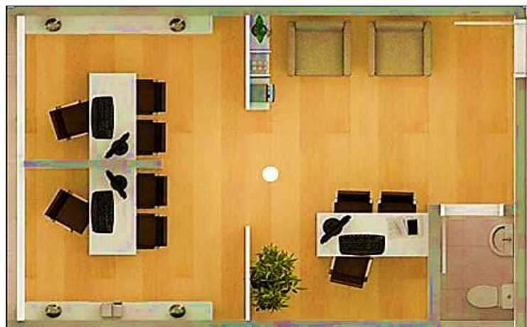
Imagen 6. Plano de distribución de la oficina del departamento de comercio exterior

En este segundo análisis, se presenta en detalle la ubicación de la oficina del departamento de comercio exterior, se dan detalles de adecuación física y obras civiles. La ubicación será en una oficina de 210 m2 los cuales serán distribuidos en dos oficinas, según los requerimientos del departamento, el punto cuenta con servicios públicos como lo son agua, luz, teléfono y gas, de acuerdo con esto también serán ubicados los enseres y equipos de cómputo correspondientes.