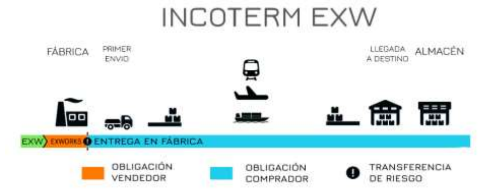
Imagen 3. Incoterm EXW