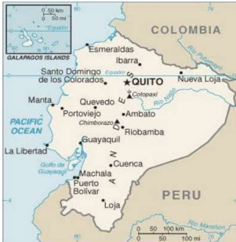
Imagen 2. Mapa político de Ecuador