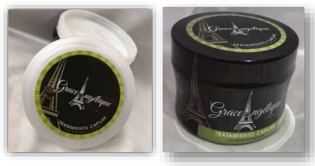
Imagen 1. Presentación Tratamiento Capilar con extractos naturales

Nota: Las imágenes fueron tomadas en la ciudad de Bogotá, el 17 de Febrero de 2019.