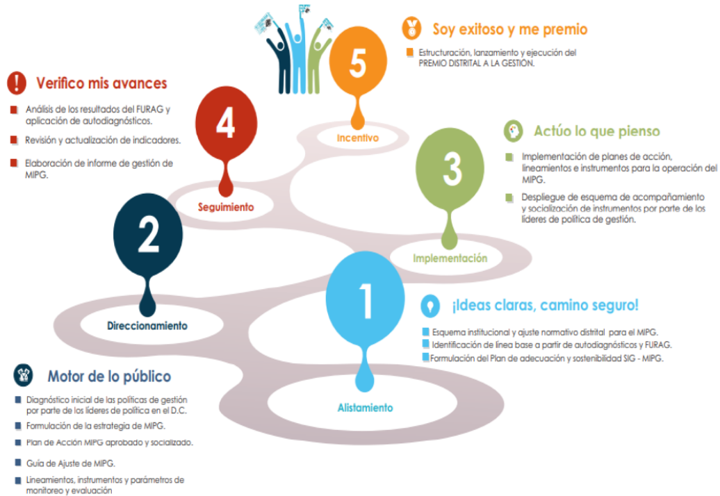
Figura 4. Ruta de la Gestión.