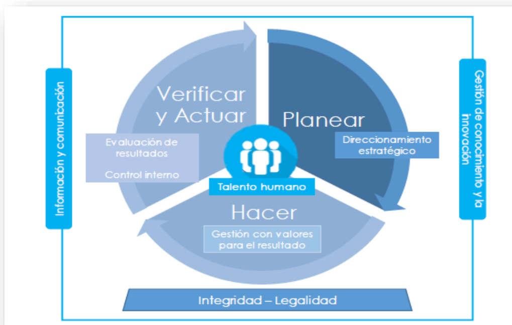
Figura 2. Estructura General de Modelo de Planeación y Gestión.

Fuente: Función Pública, basado en el Manual Operativo MIPG.