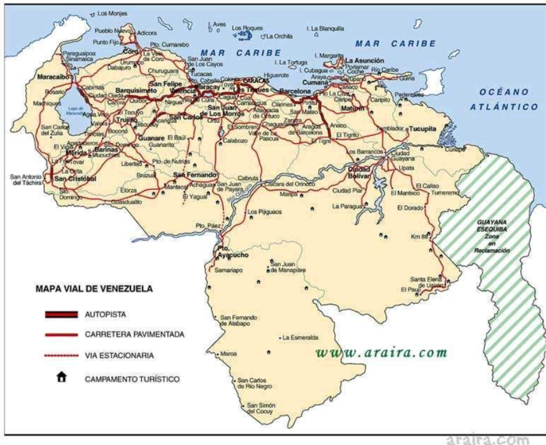
Mapas viales de Venezuela