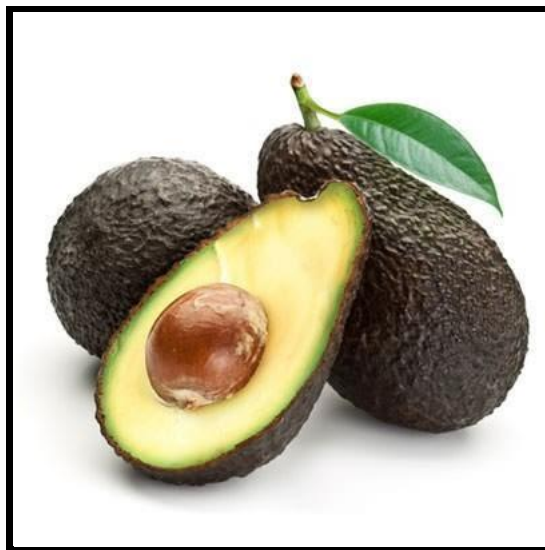
Presentación del aguacate Hass

Nota: La figura representa al aguacate de variedad Hass.