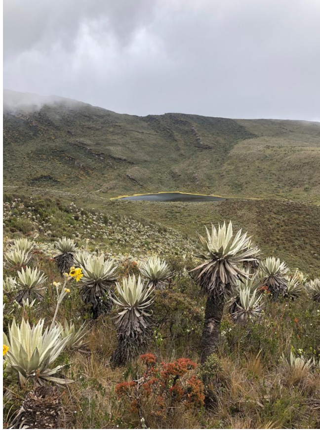
Nota. Fotografía del páramo de Chingaza. Tomada en junio de 2022 por el autor.